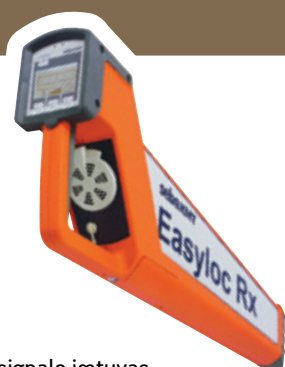
Rx signalo imtuvas